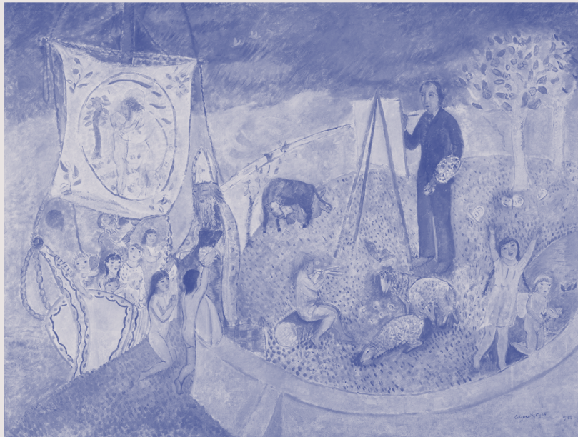
Edvard Munch. Invitation to Paradise , 1922

Een zucht is onzichtbaar net als de wind de nacht is onzichtbaar als de dag begint onzichtbaar zijn de dingen die ik kwijt ben die ik nooit meer vind maar met mijn ogen dicht zie ik alles wat mijn hoofd verzint