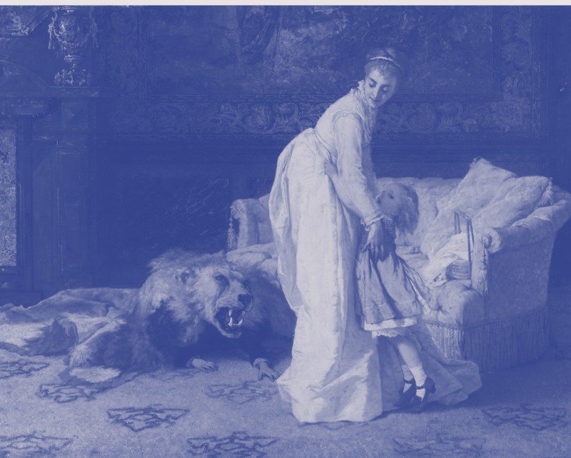
Frans Verhas, De leeuw , 1874