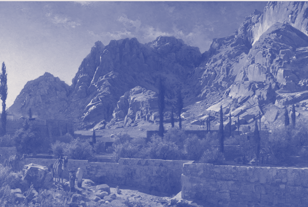
Adolf von Meckel, Het Sint-Catharinaklooster in de Sinai (Egypte), 19e eeuw