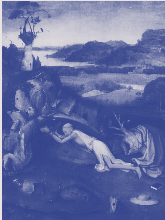
J. Heronimus Bosch, De heilige Hieronymus , ca. 1500

Maar nu ik me alleen voel en verlaten, beginnen zij ineens te praten