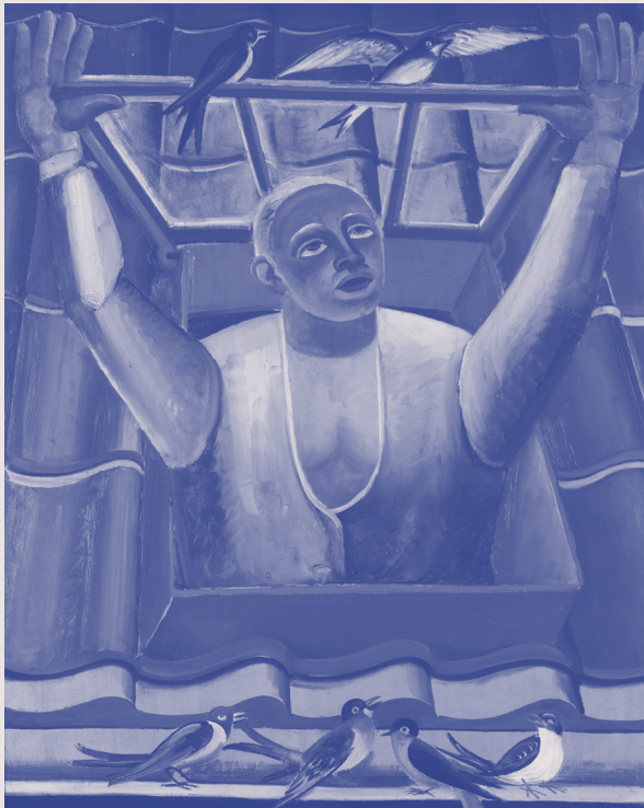
Prosper De Troyer, Met de vogelen , 1928

De man op het schilderij steekt zijn hoofd door het raam. Stel je voor dat jij je hoofd door jouw raam thuis steekt. Schrijf op wat je dan zou horen, zien, ruiken, voelen en proeven.