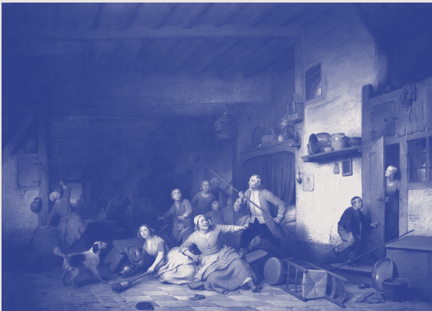
Ferdinand De Braekeleer. De vleermuis , 1860