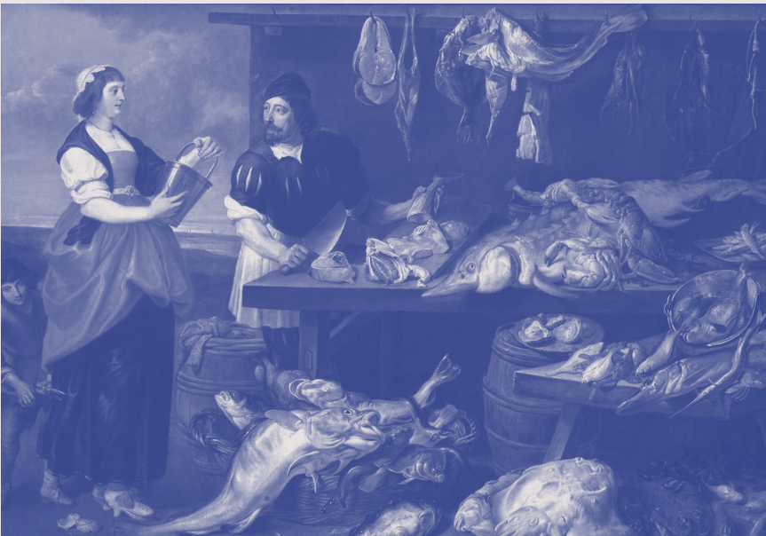
Adriaen Van Utrecht, Kraam van een visboer , 17e eeuw